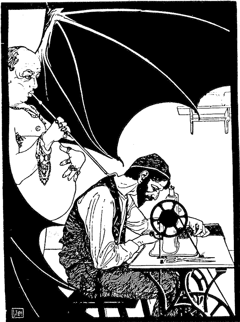
"הערפד המוצץ את דמם של היהודים העובדים ב'כוכי היזע' - איור של ליליין לספר שירים של מוריס רוזנפלד

הפך בעלי לרוכל המוכר את מרכולתו מדלת לדלת, והקשיים בסוג זה של עיסוק רבים: מעטים הם הקונים ומעטים יותר הם אלה העומדים בתשלומים. בנוסף לכל אלה, עובדת היותו מזוקן מעודדת שודדים וחוליגנים לגנוב את כספו ומרכולתו. במצוקתו לווה כספים מתבריו ואני מודאגת מאוד מכך. המצב הולך ונעשה קשה. בעלי אינו רוצה לגלח את זקנו, ובנוסף לכך מבקש בני לנסוע ולבקר את אחותו וזו הוצאה של $25. מה אעשה? אני מחכה לעצתך. תשובת העורך: מאחר ואין נראית ההצלחה בעבודתו בעיר זו, מוצע למשפחה לעבור לעיר שבה מתגוררת הבת. אשר לזקן: אם האיש דתי וזו הסיבה לסירובו לגלחו, ניתן להבין זאת, אך אם