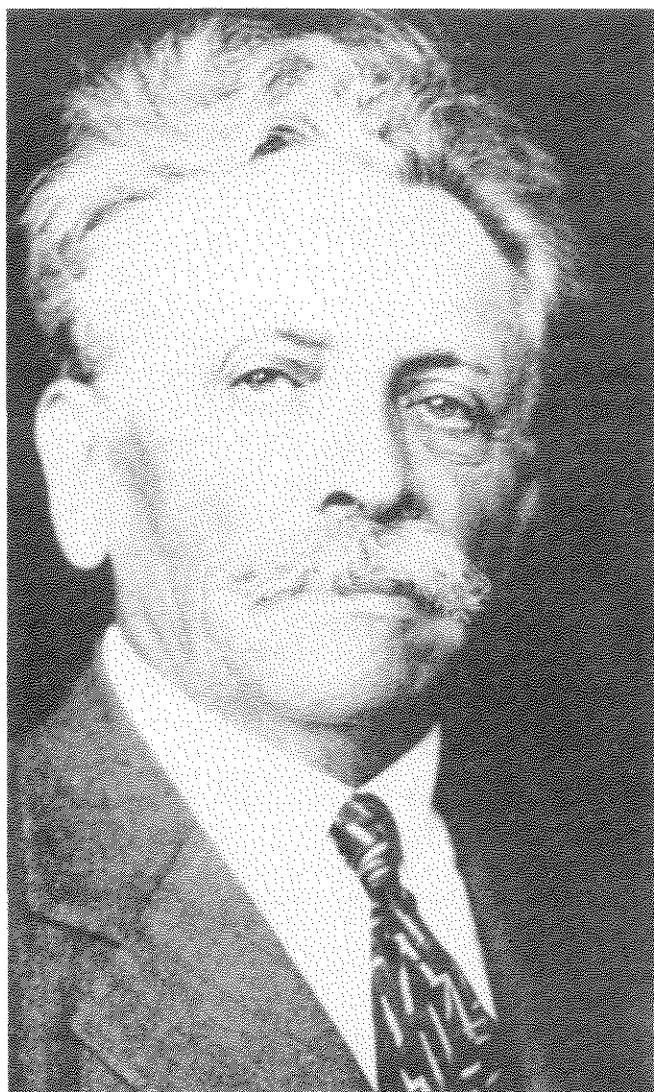
אייב קאהאן, עורך ה"פארווערטס" במשך יותר מחמישים שנה והאיש שמאחורי ה"בינטעל בריוו"

זה, איני מצפה שתוכל לסייע לי באורח ממשי, אך מאחר ואתה מתמצא יותר במצב — אנא תן עצתך. האם כדאי לבני להמשיך את לימודיו בכימיה ואולי מוטב שאעשה אותו לחייט? תשובת העורך: אנו מציעים שבנך ילמד את המקצוע בו הוא מגלה עניין ולמרות כל הקשיים הוא ימצא דרכו בבוא העת. [הערה: בשנות ה-60 וה-70 ניתן היה עדיין למצוא יהודים בעלי חנויות לכלי בית ואבזרים טכניים בני 60-70 שנה — למרות השכלתם הפורמלית כמהנדסים. הללו נידחו בגלל אנטישמיות ממפעלי תעשייה ונאלצו, כתחליף, לפתוח חנויות. רבים בחרו, כמובן, לעסוק במסחר בתחום הקרוב ככל האפשר למקצועם].