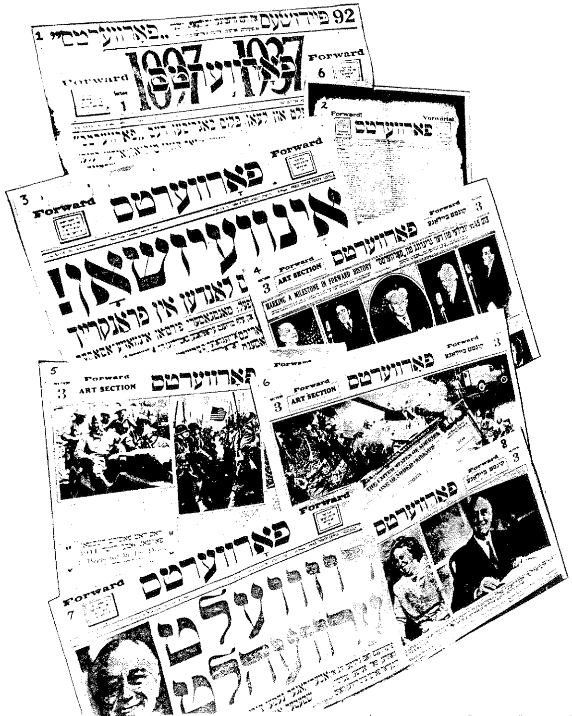
במשך שנים היה ה"פארווערטס" היומון היהודי המוביל באמריקה. בעמוד זה: כמה מעמודיו הראשונים עד אמצע שנות ה'40