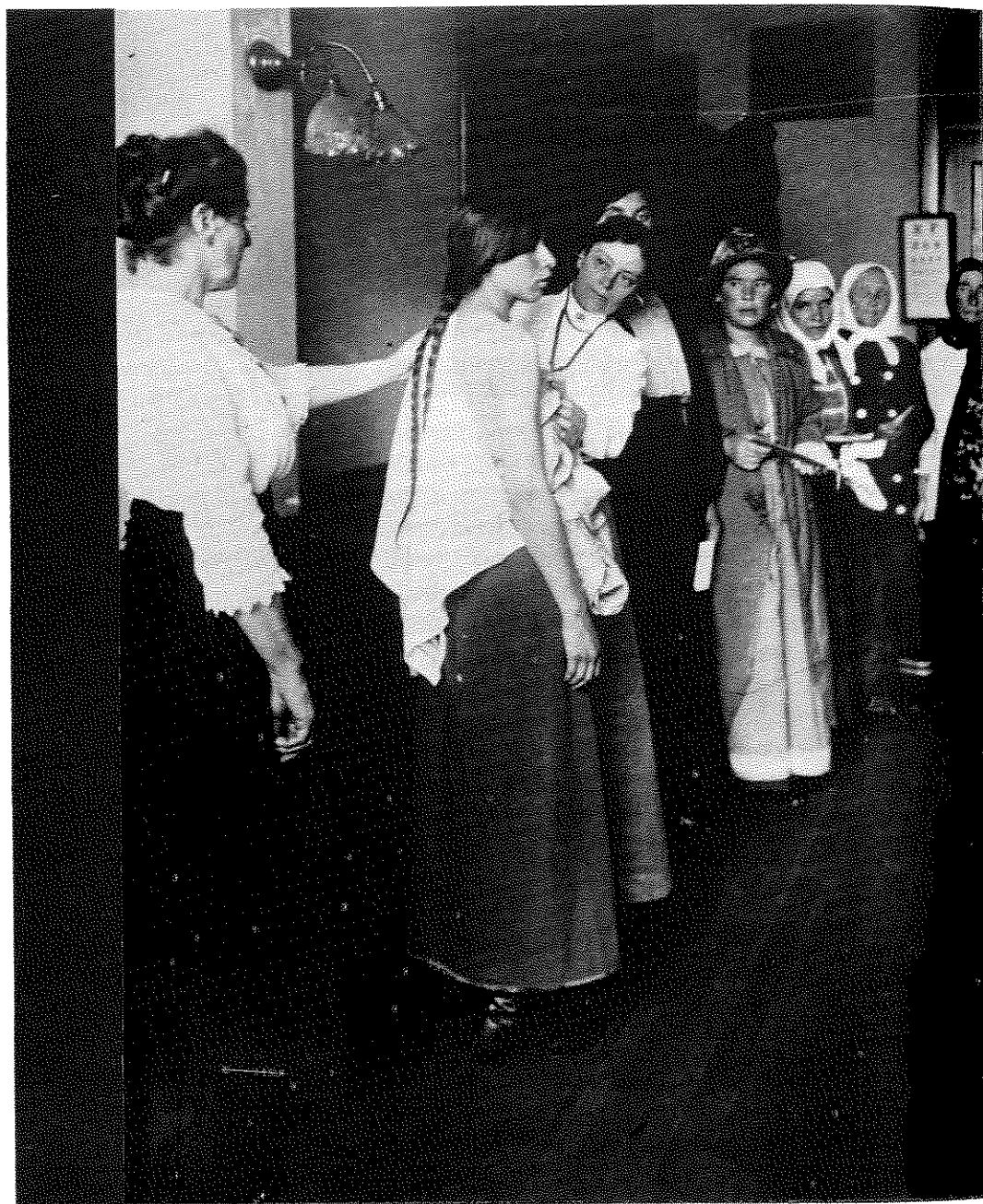
בידיה רפואית של מהגרות יהודיות מרוסיה באליס איילנד ("אי הדמעות") – שנת 1900 לערך

בשבילי". זאת ועוד: הם כבר אינם שומרים על כשרות ומוטב לי שאשאר כאן, למרות כל זאת החלטתי לנסוע לאמריקה. ואכן, כשהגעתי חיכו לי כולם בנמל והשמחה היתה גדולה. היש אושר גדול מזה לאם? וכאן צצה הבעיה שבגינה אני כותבת לך. כמה